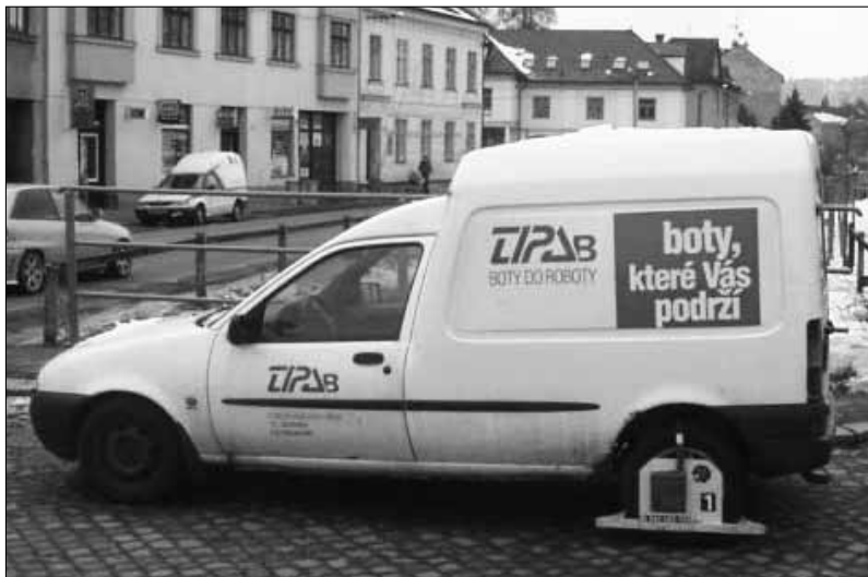
Pevně drží a neprošlapou se!