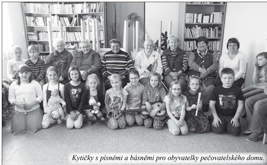
Kytičky s písněmi a básněmi pro obyvatelky pečovatelského domu.