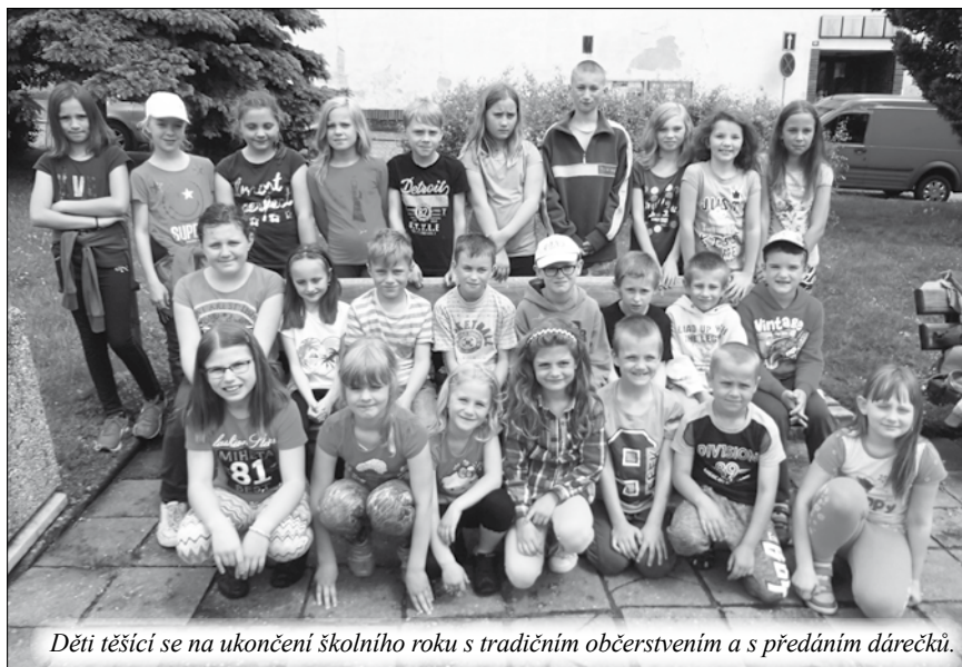
Děti těšící se na ukončení školního roku s tradičním občerstvením a s předáním dárečků.