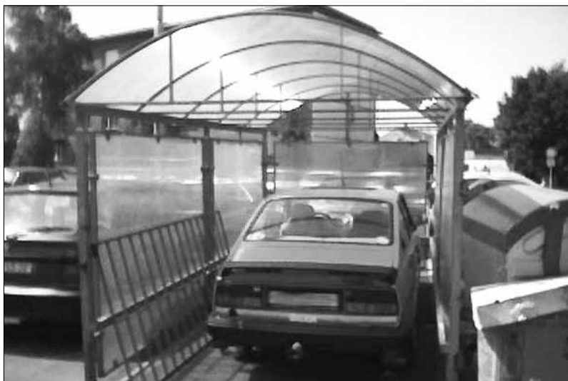
Ochrana před neočekávaným krupobitím!