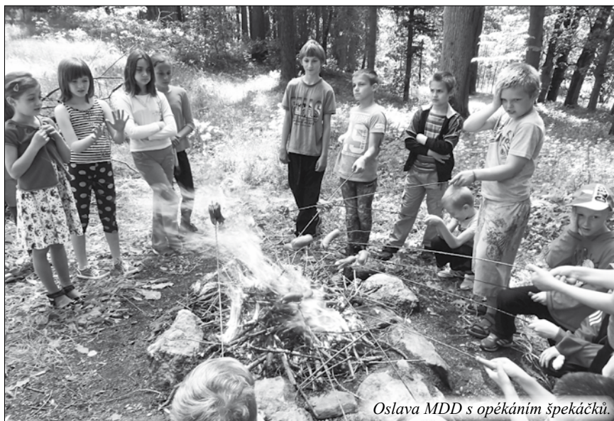
Oslava MDD s opékáním špekáčků.