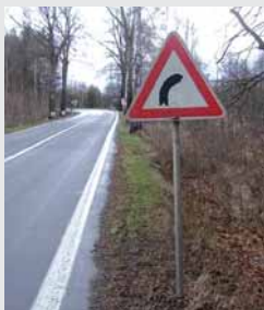
Řešení pro koně!