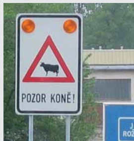
Snad tady ty?