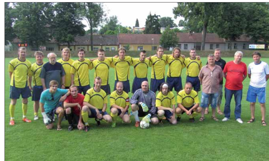
A“ tým dospělých Sokola Černovice – hráči, funkcionáři, fotbalová sezona 2014/2015