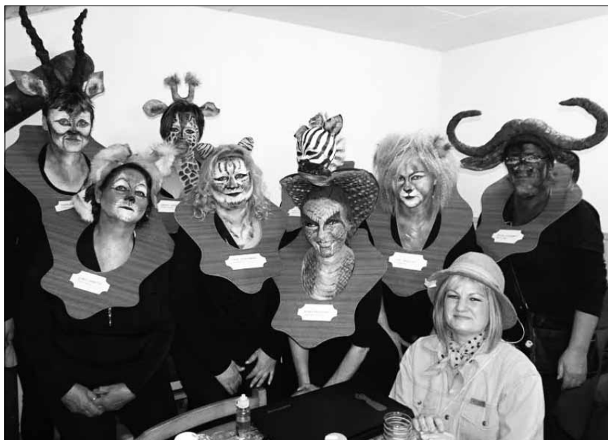
Černovický svaz žen na vystoupení při černovických sokolských šibřinkách

s Archimedeou, Elza, mašinka Tomáš, Harry Potter, Scooby Doo, Batman, Minie, nemohla chybět Červená Karkulka, včelka Mája, Homer a Marge Simpsonovi, Anděl Páně...zkrátka zúčastnily se snad všechny ikony filmové a televizní zábavy.